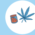
CANNA- BINOÏDES (CHANVRE ET DÉRIVÉS)