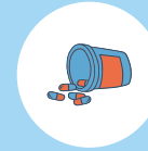
PSYCHO- STIMULANT (AMPHÉTAMINE, ANTIDÉPRESSEURS, CAFÉINE)