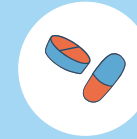
BENZO- DIAZÉPINE (SOMNIFÈRES, CALMANTS, BANKIOLYTIQUES)